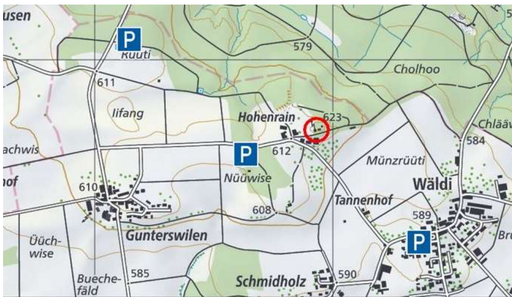
Napoleonturm und Parkplätze in der Nähe